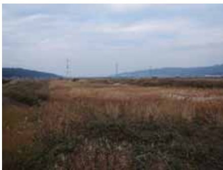
羽咋川水系の下流部