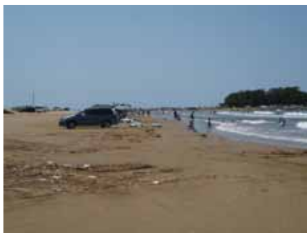
海岸でのヨシの漂着

海岸でのヨシの漂着状況や河川での分布状況を図2.3-1に示す。海水浴シーズンに海岸に漂着したヨシは、景観を大いに阻害していた。また、羽咋川の上流部の中能登町付近の川幅は狭く、ヨシも河川の土手周辺に生育していたが、下流部では河幅も広く、ヨシは河川敷に広く生育している状況にあった。