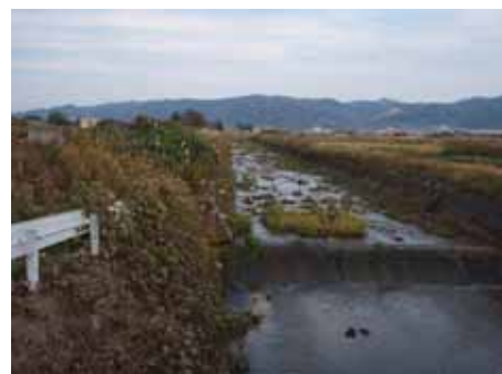
羽咋川水系の上流部