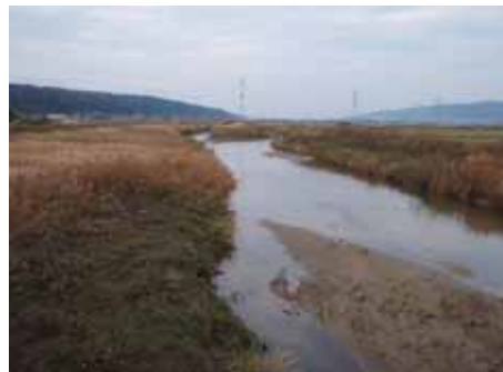
羽咋川水系の下流部