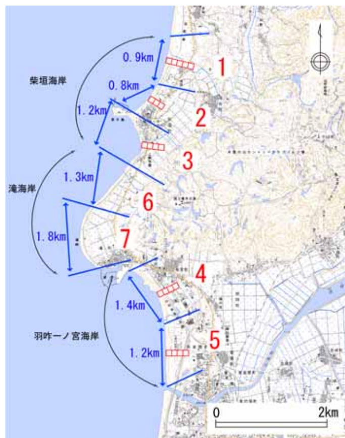
図 1.2-1 調査範囲