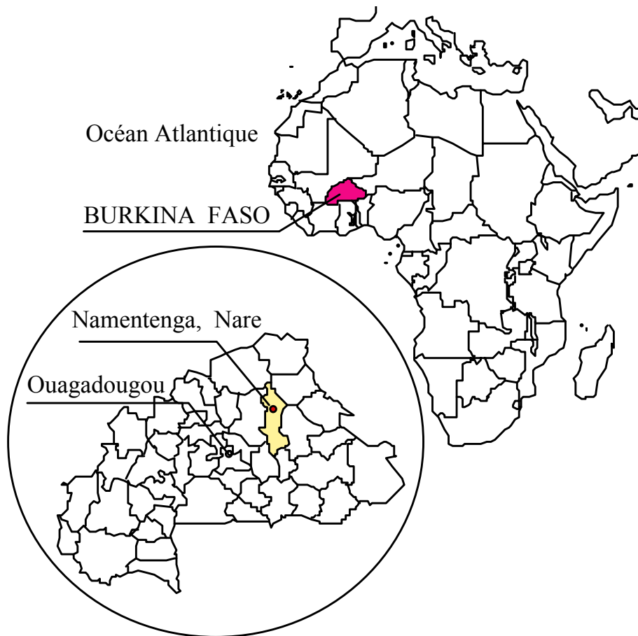
Plan de situation pour le projet