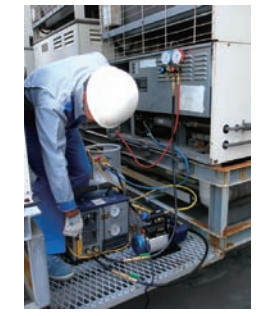
スーパーマーケット冷蔵ショーケース(室外機)からのフロン類冷媒回収の様子

特定のフロン類使用機器を廃棄するときは、法律に従って行う必要があります。機器の種類により、業務用の冷凍・冷蔵・空調機器はフロン排出抑制法、家庭用エアコン、冷蔵・冷凍庫、洗濯乾燥機(ヒートポンプ式)は家電リサイクル法、カーエアコン(自動車の廃棄時)は自動車リサイクル法によって規制されており、これらの機器を廃棄するときには、フロン類が大気中に放出されないよう、それぞれの法律に基づいて、適切に回収して処理しなくてはなりません。特に、店舗、工場、事務所、ビルなどを改修、解体するとき、建物に据え付けられた冷蔵・冷凍機器や空調機器からフロン類が放出されないよう、工事業者とよく相談して、機器本体を廃棄する前に、フロン類回収を必ず実施してください。