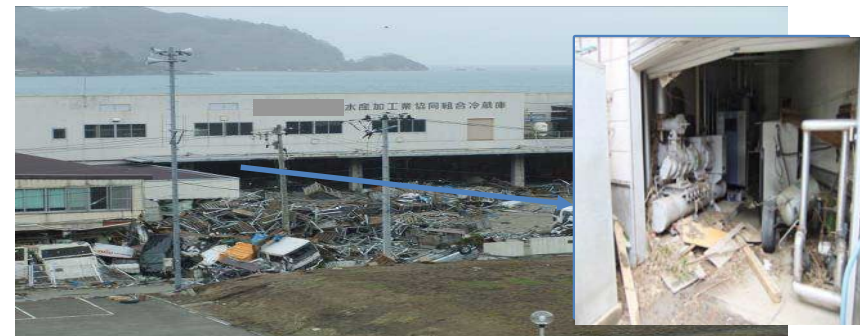
岩手県内水産加工工場