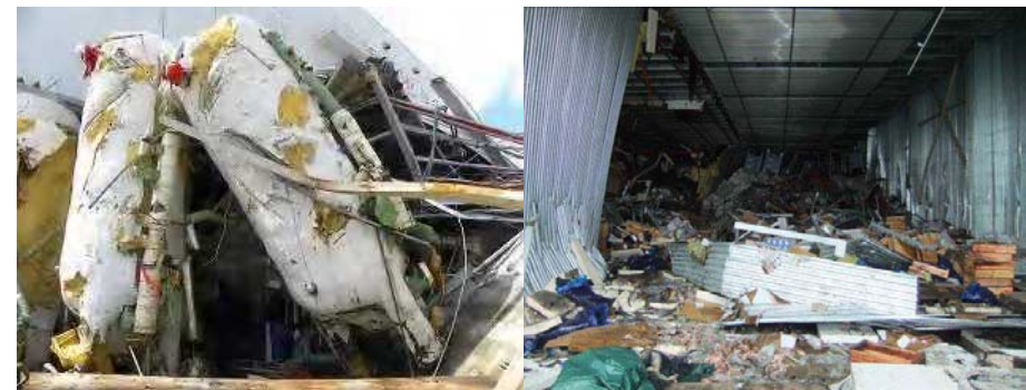
宮城県内食品工場冷凍機