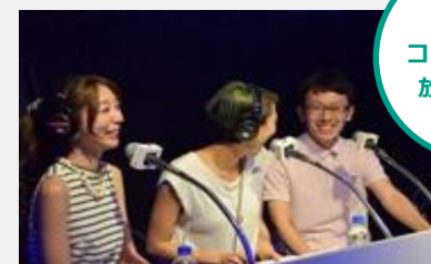
地域 コミュニティ 放送の様相