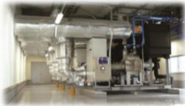
<中央方式冷凍冷蔵機器>