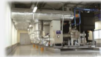
<中央方式冷凍冷蔵機器>