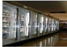
<冷凍冷蔵ショーケース>