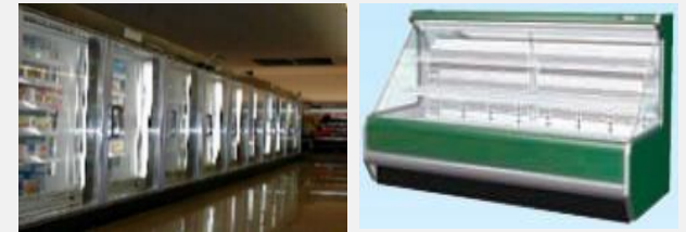
<冷凍冷蔵ショーケース>