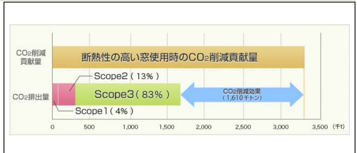
図2: CO 2 排出量と高断熱性窓によるCO 2 削減貢献量