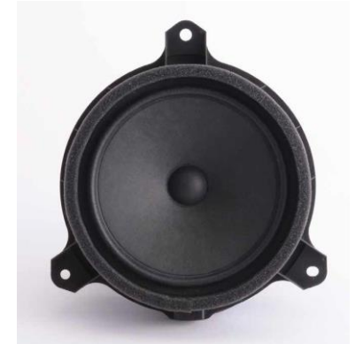
車載用軽量スピーカ