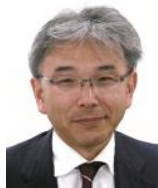
環境省 地球環境局長 森下 哲