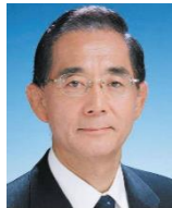
環境省 環境大臣 原田 義明

昭和45年 通商産業省（現経済産業）入省 平成9年 厚生政務次官 平成15年 文部科学副大臣 平成30年 環境大臣