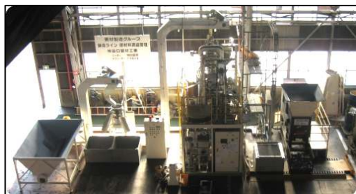
受入ホッパー、分別装置、搬送装置 洗浄装置 圧縮装置