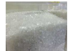
洗浄されたフレーク