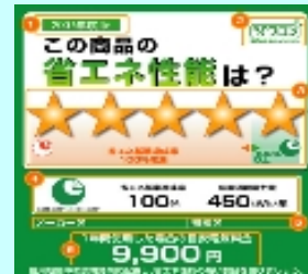
統一省エネルギーラベル