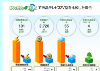
省エネ製品買換えナビゲーションシステムのデータ活用