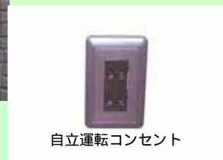
自立運転コンセント