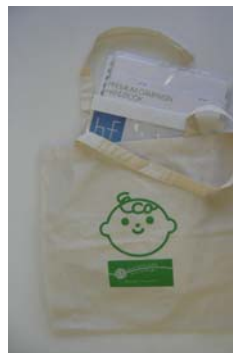
説明会封筒はエコバッグに。