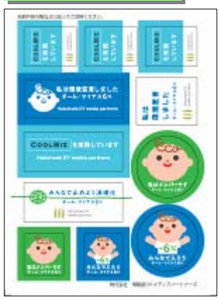
全社員、来訪者配布用ステッカー