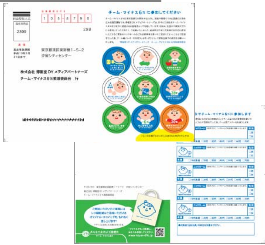
全社員の家庭に送付したステッカー付き往復はがき(2006年6月)