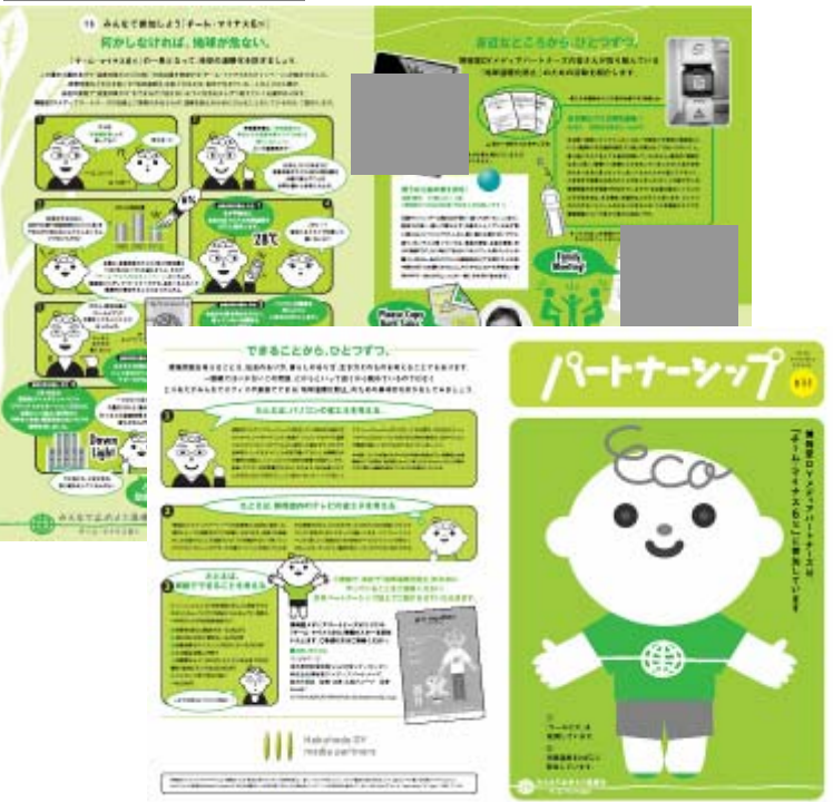
社内報での啓発 (2005年・夏号)