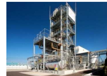
有害化学物質の放出を抑制可能な二酸化炭素分離回収設備