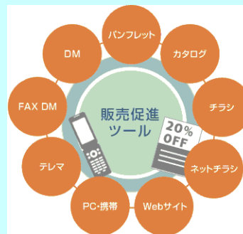
事業者の販売促進活動

なお、5つ星家電等対象製品の販売増の目標を設定するとともに、実施した販売促進策の内容や販売促進を講じた際の販売数の比較等について報告することを条件とする。