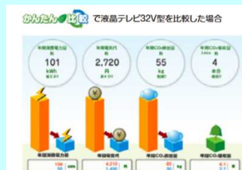
省エネ製品買換えナビゲーションシステムのデータ活用