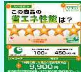
統一省エネルギーラベル