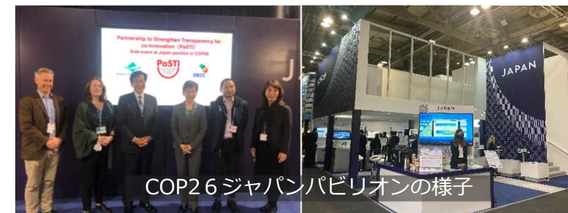
COP26 ジャパンパビリオンの様子

お問合せ先： 1./2. 地球環境局地球温暖化対策課（03-5521-8249）、3. 地球環境局国際地球温暖化対策担当参事官室（03-5521-8330）