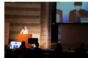
地域センター向け研修