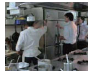
脱炭素化支援の例（商店街・飲食店と連携）