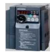
（インバータ制御装置）