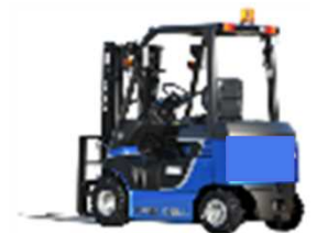
燃料電池 フォークリフト

お問い合わせ先: 環境省 地球環境局 地球温暖化対策課 地球温暖化対策事業室 電話: 03-5521-8339 環境省 水・大気環境局 自動車環境対策課 電話: 03-5521-8302