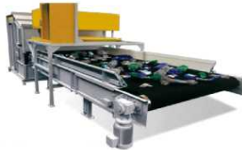
廃プラの選別設備