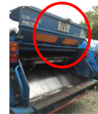
画像認識システム (収集運搬車に搭載)