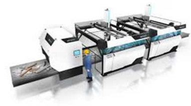
AIによる省CO 2 型の選別設備