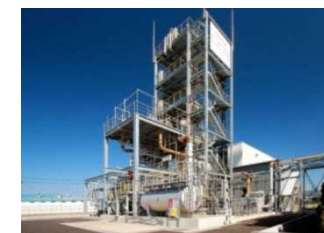
有害化学物質の放出を抑制可能な二酸化炭素分離回収設備