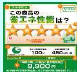
統一省エネルギーラベル