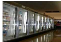
＜冷凍冷蔵ショーケース＞