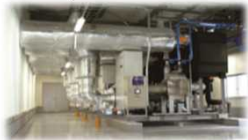
＜中央方式冷凍冷蔵機器＞