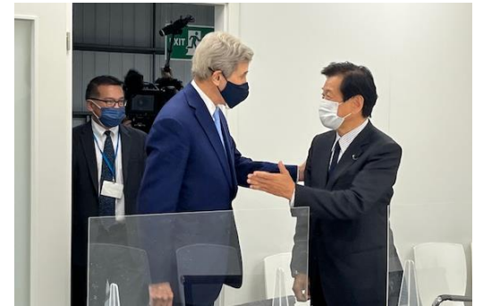
米・ケリー大統領特使とのバイ会談