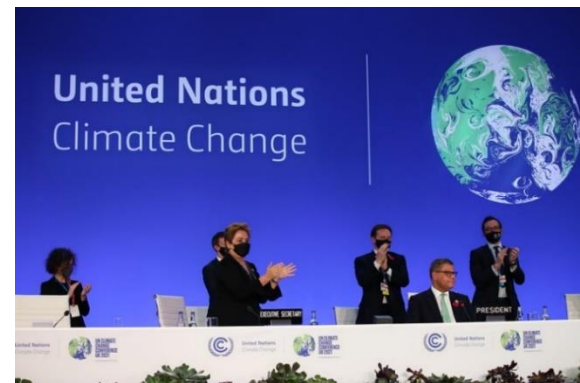
COP26決定文書採択の瞬間

2025年以降の新たな途上国支援の数値目標の議論を開始。新たな協議体を立ち上げ、2024年まで議論することとなった。