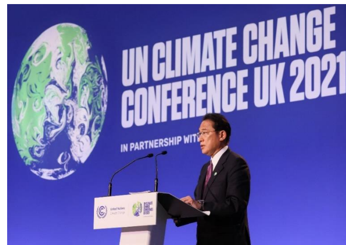
世界リーダーズ・サミットで演説を行う岸田総理