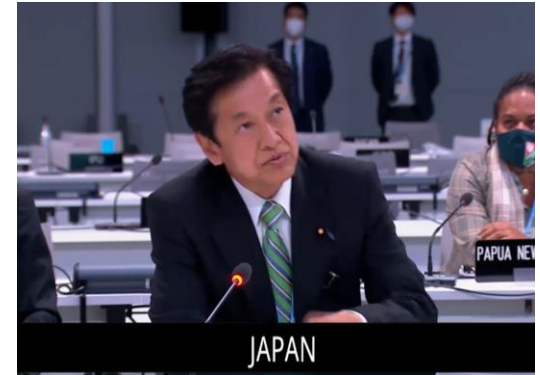
クロージング・プレナリーでのステートメント