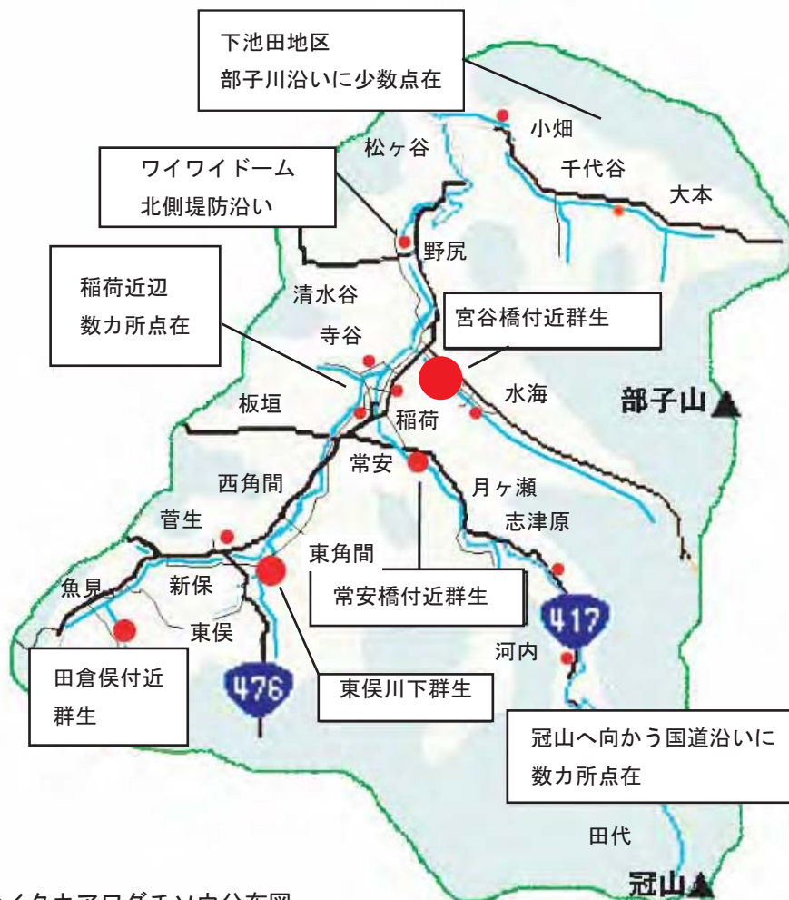
セイタカアワダチソウ分布図