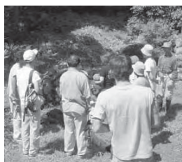
足日（たるひ）の清水

年中水温が一定で、どんな渇水の年でも水が絶えない。以前より水量は減ったそうだがとても美味しい水。