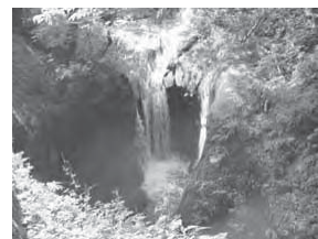
大本上流おう穴群

水の流れることによって岩に穴が開くおう穴（ポットホール）が大小群生する。構造と規模の両面で非常に貴重とされている。