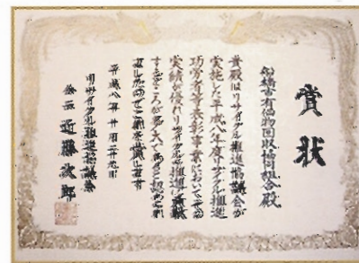
リサイクル推進功労者賞