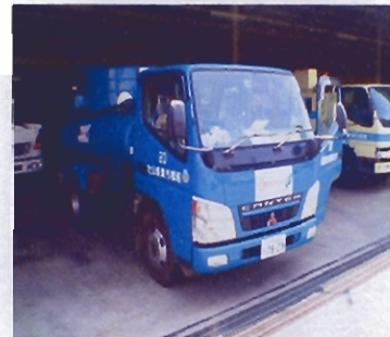
(船橋市清美公社車両)

地域全体が防犯に対する意識が高まったせいか、下のグラフでわかるように平成15年をピークに犯罪件数は減ってきている。今後ますます、地域防犯パトロールの活発化やネットワークの広がりなどで、防犯件数は減ると予想される。