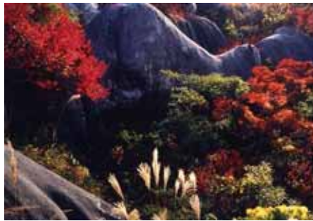
紅葉の平尾台 (小倉南区)