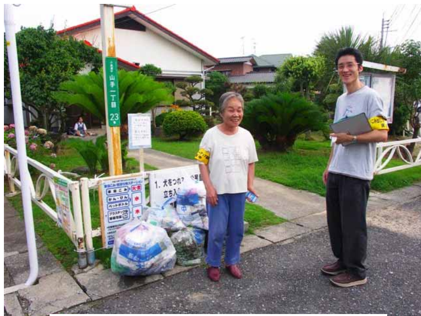
市民分別協力員(左)と市職員