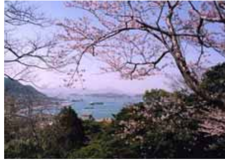
春の海峡 和布刈公園 (門司区)