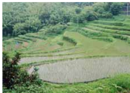
合馬の棚田 (小倉南区)