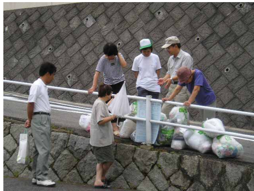
プラスチック製容器包装分別初日