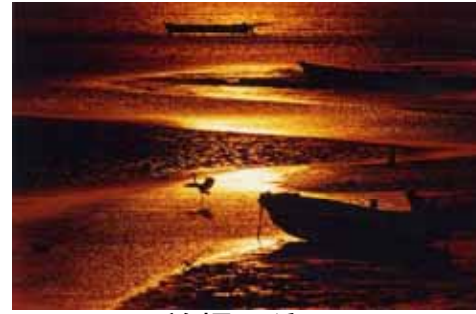
曾根干潟 (小倉南区)