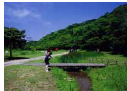
山田緑地 (小倉北区)