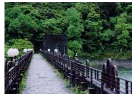
河内貯水池 (八幡東区)