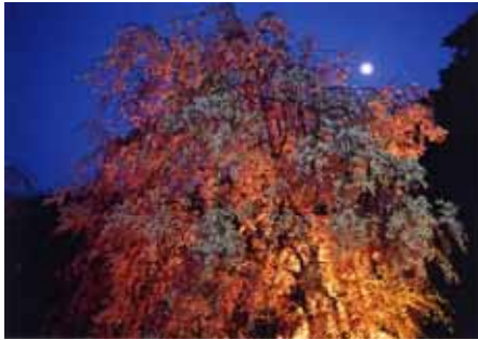
春宵の桜 妙見神社 (小倉北区)