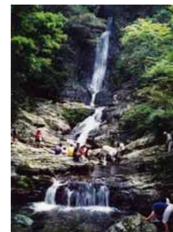
菅生の滝 (小倉南区)