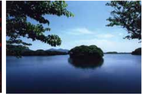
頓田貯水池 (若松区)