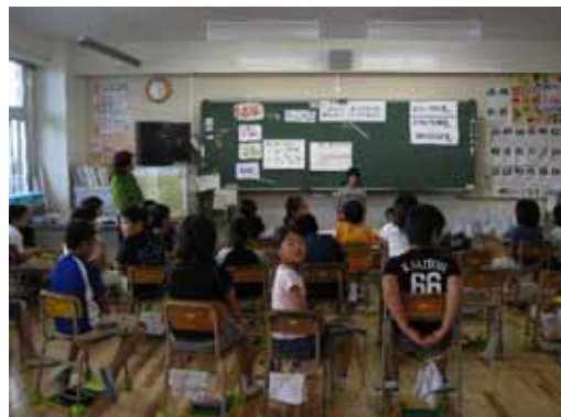
【一部完成後の環境学習の様子】 明るく、涼しくなりました

改修内容：外断熱、内装の木質化、太陽光・風力発電、壁面緑化、昼光利用 雨水利用灌水、換気方式の変更（夜間換気、校舎内の風の道）など