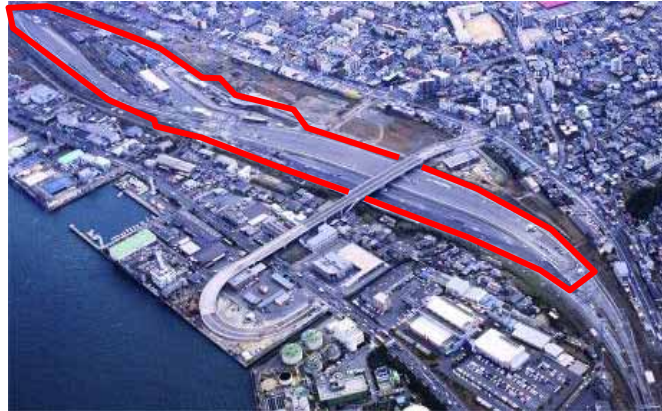
北九州貨物ターミナル駅