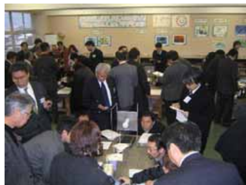
【地域の建築技術者との検討会】