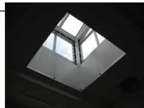
【ソーラーチューブ】 昼光取入、風の道