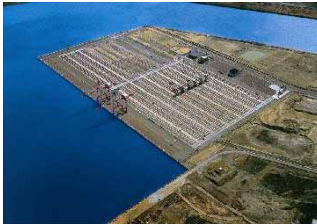
ひびきコンテナターミナル