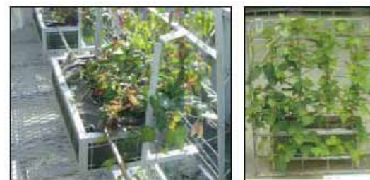
壁面緑化プランターイメージ