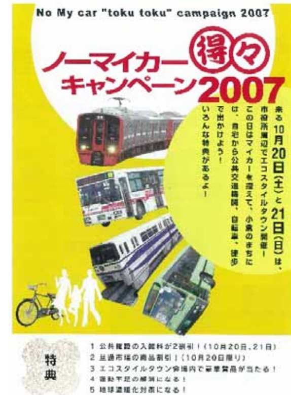
【キャンペーンチラシ】