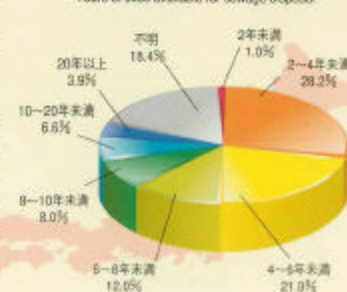
下水汚泥を受け入れている最終処分場の残余年数 Years of sites available for sewage disposal

Recently, it is getting very difficult to secure sites for sludge disposal year by year, which have a possibility to cause damage of environment. About fifty percent of public organizations are able to secure the landfill sites for less than six years. To prolong time to use the valuable landfill sites, we have to make efforts all the more to decrease the generation of the sludge volume and to promote the beneficial use of the biosolids.