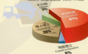
下水汚泥の処分状況 (平成10年度) States of sludge disposal (As of F.Y.1998)

現在、発生汚泥の約6割は有効利用されていますが、残りのほとんどは、埋立処分しています。