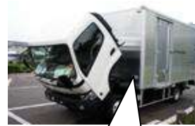
バン型車の表示例