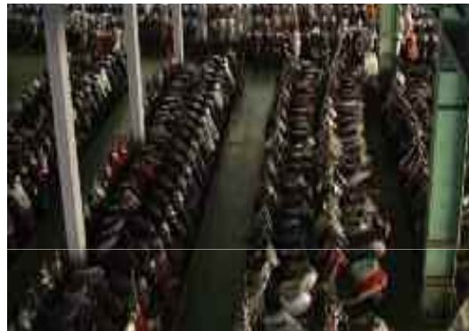
買取車両の屋内保管