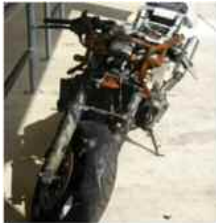
前部が燃えたバイク(オークションに出品される)

オークションへの出品台数の変化をみると、1991年を100とした場合、2005年に211.9%と15年で2倍強の扱いとなる一方、成約台数は2000年に既に1991年の2倍に達し、2005年には1991年の2.5倍と、出品台数増加速度を上回る速さで成約台数が増えている(右グラフ)。この背景には高額車両から廉価車両まで幅広い車種において旺盛な輸出需要がある。中古二輪車の相場が高くなり、廃棄に相当する二輪車であっても出品され、取扱台数が増えていった。