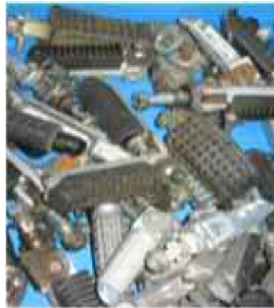
ペダルの入った箱(部品だけを集めてオークションに出品される)