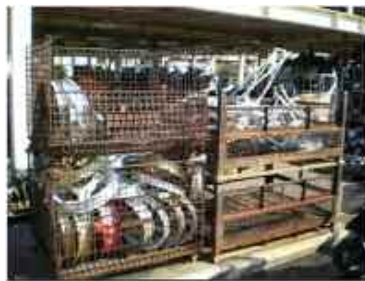
不動車から取り外されたシャーシー、ホイール、エンジン、マフラー等(集めて売却される)