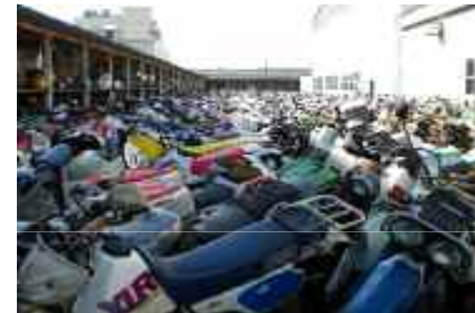
買取車両の屋外保管