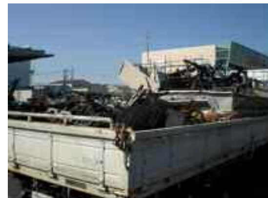
平ボディトラックに積み込まれ金属商に売却される有価物(月1回程度)