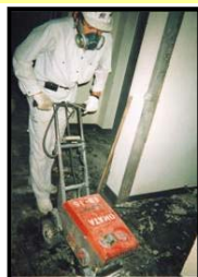
アスベスト含有形成版撤去