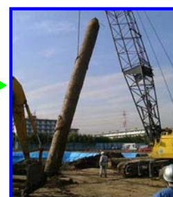
基礎及び基礎杭の撤去 17