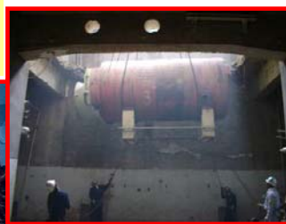
建築設備の取り外し