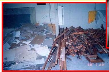
内装材(木材・廃石膏ボード)の分別