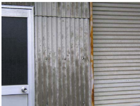
石綿スレート(屋根・外壁)