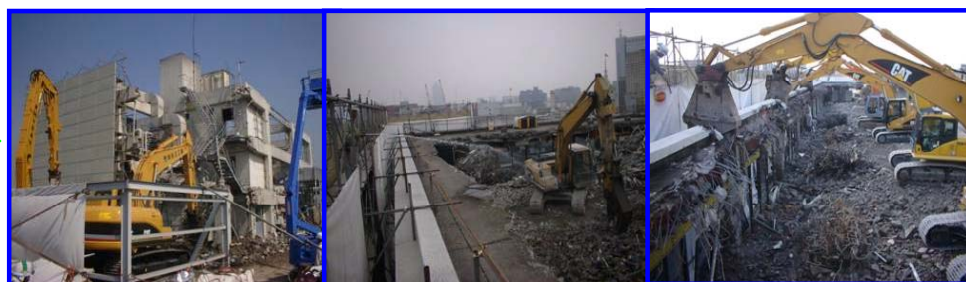
躯体の解体(屋根、外装材、構造体を同時に取り壊し)