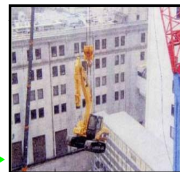
クレーンで重機を揚重して屋上に設置