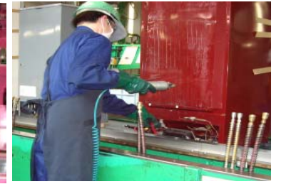
冷蔵庫冷媒フロン回収