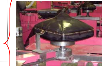
テレビブラウン管ガラスの解体