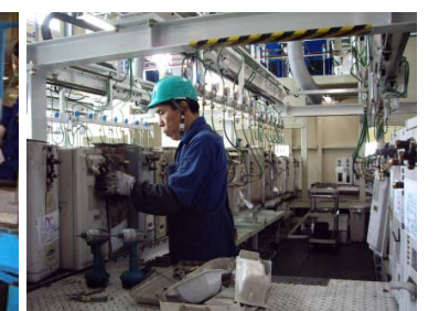
エアコン冷媒フロン回収