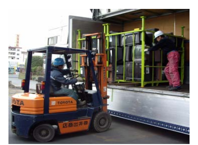
指定引取場所からRPへの運送