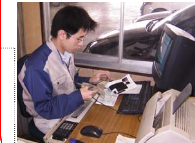
家電リサイクル券システムへの入力・送信