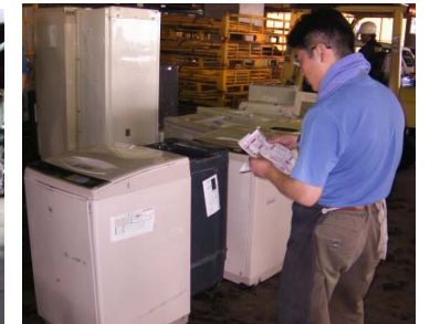
家電リサイクル券との照合