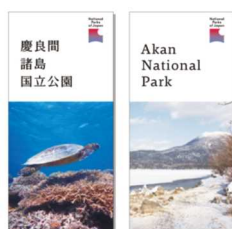
パンフレット、標識サインへの展開イメージ