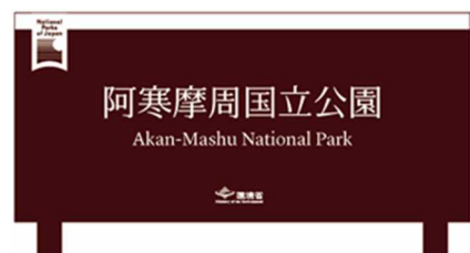
図2 国立公園統一マーク及び国立公園フォントによる統一的ブランドイメージ