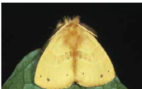
成虫 : 開張♂ 25 ~ 33mm ♀ 37 ~ 42mm

防除方法 : チャドクガに準ずるが、年1回発生であること、幼虫で越冬することから幼虫の発生時期が違うことに注意を要する。