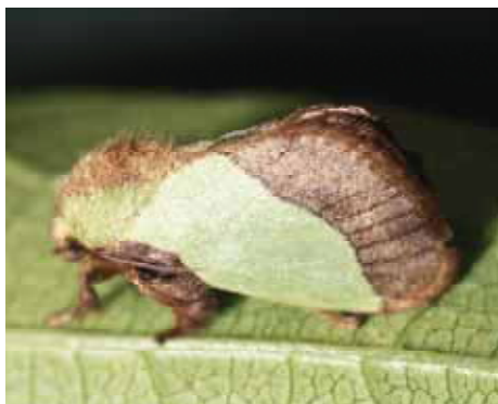
成虫：翅は緑色で前縁は茶色。茶色の部分の幅がアオイラガより広い。

防除方法：幼虫が集合して加害している場合は、寄生部分の剪定など物理的な防除が有効。冬期にマユを確認した場合は掻き取る。