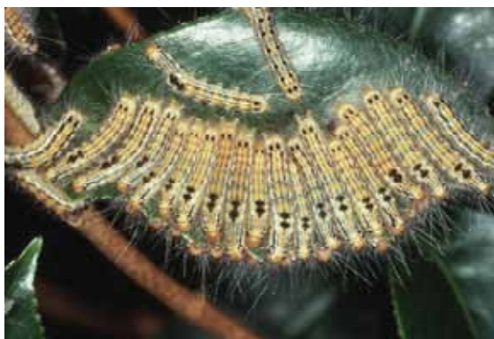
幼虫：集団で加害をする。 中齢幼虫以降分散する。