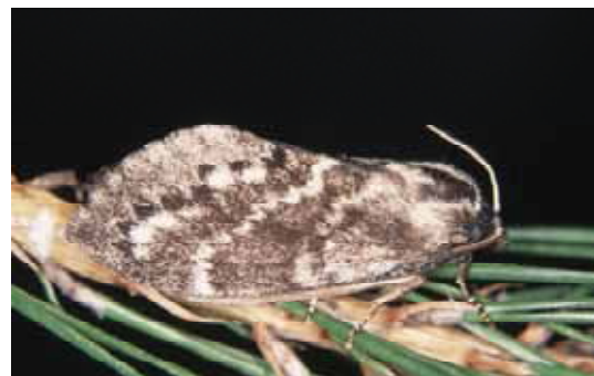
成虫：開張♂ 45～60mm ♀ 70～90mm