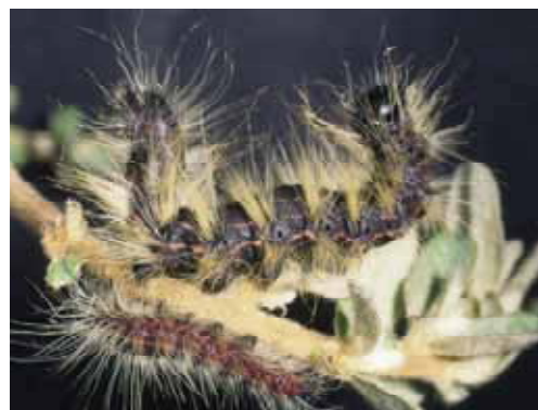
成熟幼虫(上)と中齢幼虫(下)：体色は灰黒色で長い毛がある。成熟幼虫の体長は約 50mm