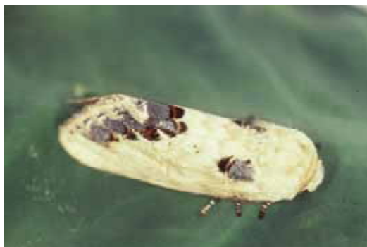
成虫：開張♂ 46 ~ 54mm ♀ 55 ~ 59mm

防除方法 :分散前の幼虫を枝ごと切り取る。サクラには生物農薬であるBT剤の適用があり、それ以外の農薬にも適用がある。散布する際は発生樹木に限定して散布する等飛散防止に努める。またサクラには樹幹打ち込み剤も適用がある。