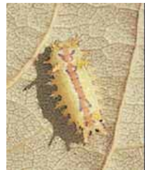
幼虫：成熟幼虫では体長約 18mm

分布や寄生植物はほとんどイラガと同じ。ただし、年2回発生し、幼虫は6～7月と8～9月に見られる。