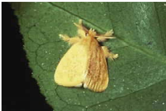
成虫：開張♂ 24 ~ 26mm ♀ 27 ~ 35mm

防除方法：家庭の庭等管理が容易な場所では、冬のうちにたんねんに葉裏の卵塊をさがして除去することも可能。また、幼虫のまだ小さいうちに葉を切り取って踏みつぶしたり、ビニール袋で覆って、枝や葉を切り取って袋に入れるのも効果的な防除法。駆除は風のないときを選び、毒針毛が直接皮膚に触れないようにして行う。また、集団に対して農薬をスポット的に散布することも可能。幼虫が大きくなると集団がいくつにも分かかれ、被害が樹全体に及び、物理的な除去は毒針毛等が人へ付着し危険。ツバキ及びサザンカには生物農薬であるBT剤の適用があり、その他の農薬にも適用がある。使用する場合は、できるだけ飛散しないよう注意を要する。