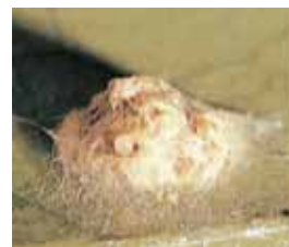
卵塊：葉裏に卵塊を産んだ後に、雌は腹部の毛で覆う。