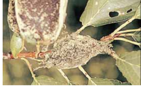
成虫：開張* 22 ~ 36mm