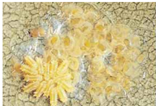
卵とふ化直後の幼虫：葉裏に水をたらしたように卵塊で産む。若齢幼虫期は集合して食害する。