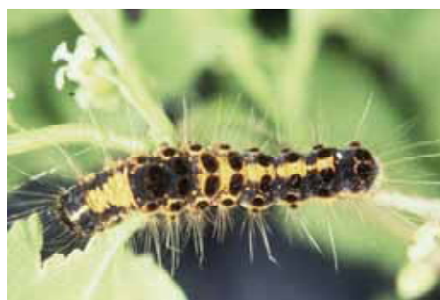
成熟幼虫 : 体長約 40mm