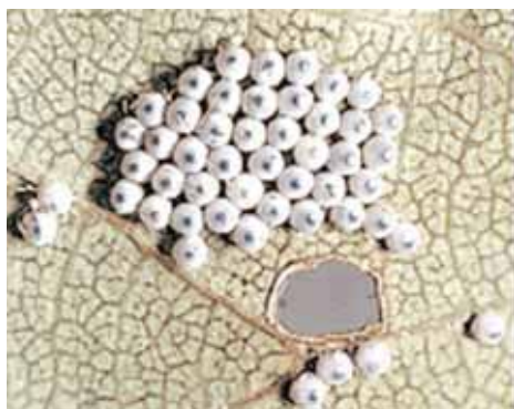
卵塊：葉裏に数十粒の卵を産みつける。初めは白いがやがて眼点が現れふ化する。