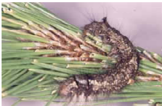
幼虫：成熟幼虫では体長約 70mm

防除方法 :冬の間、幼虫が根際などの狭いところにもぐりこんで越冬する習性を利用して、マツの幹にワラで作ったこもを巻き、越冬のため移動中の幼虫を呼び寄せて、翌年の春にワラごと焼却する。