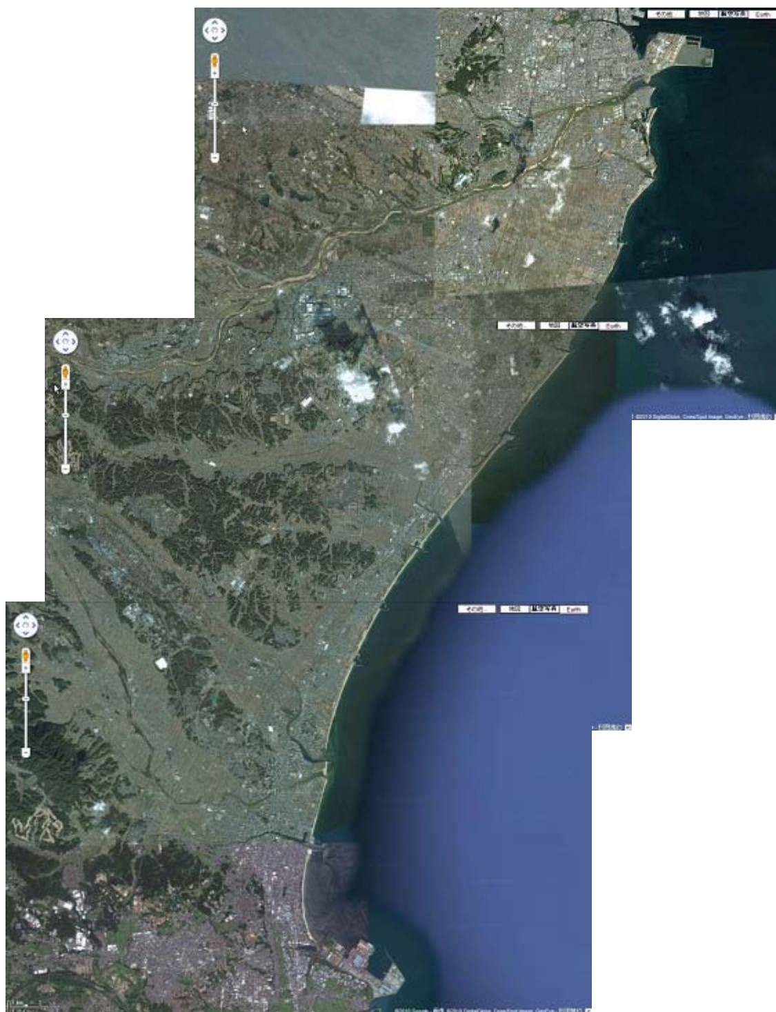
图 5. 6 (4) 沿岸景观 (铃鹿地先)