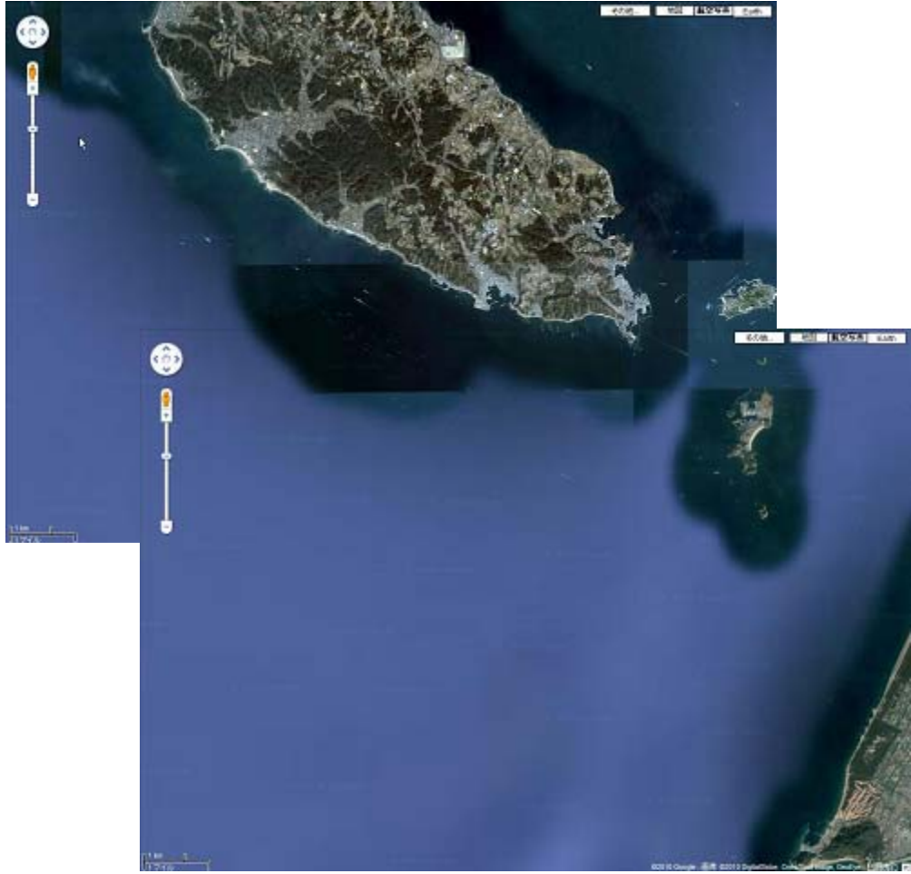
图 5. 6 (7) 沿岸景观 (知多半岛南部)