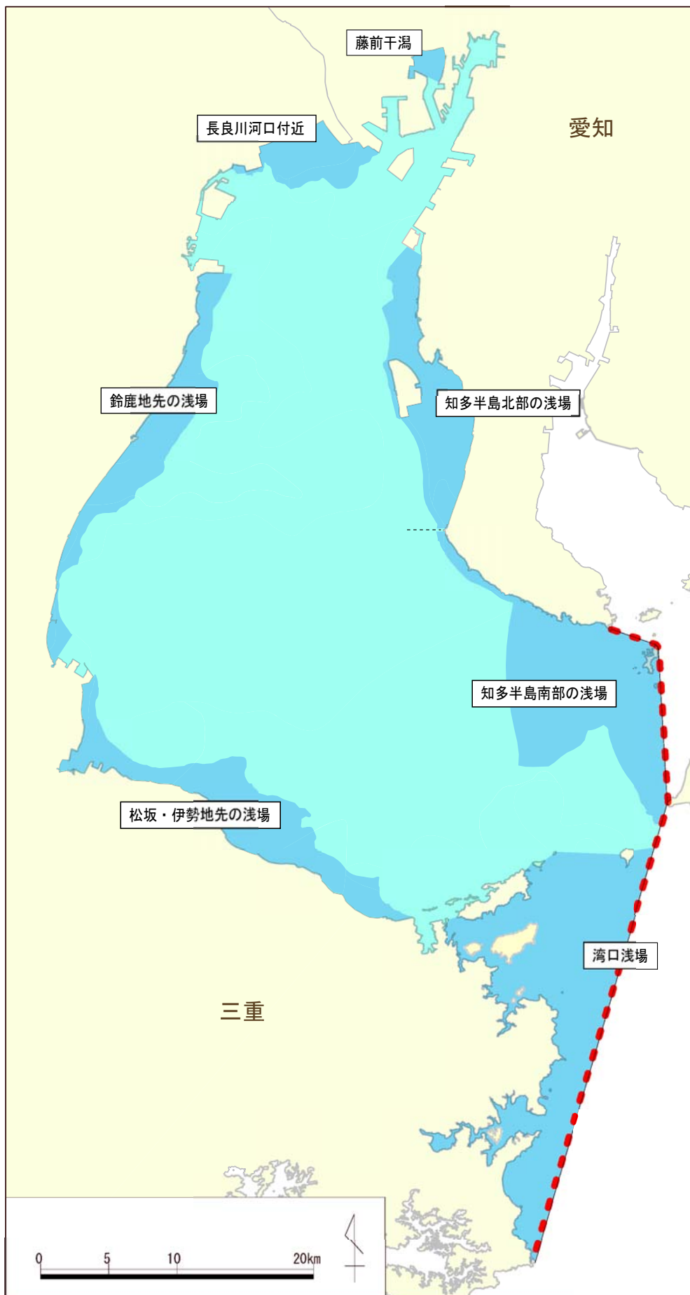
図5. 7 伊勢湾における特別域検討対象水域