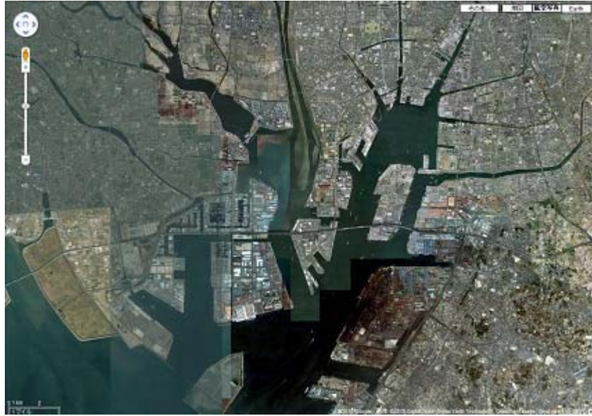
图 5. 6 (2) 沿岸景观 (藤前干潟)