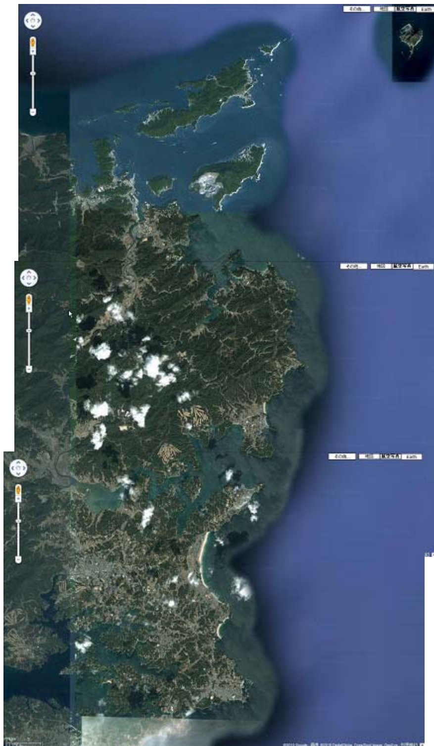
图 5. 6 (8) 沿岸景观 (湾口部)