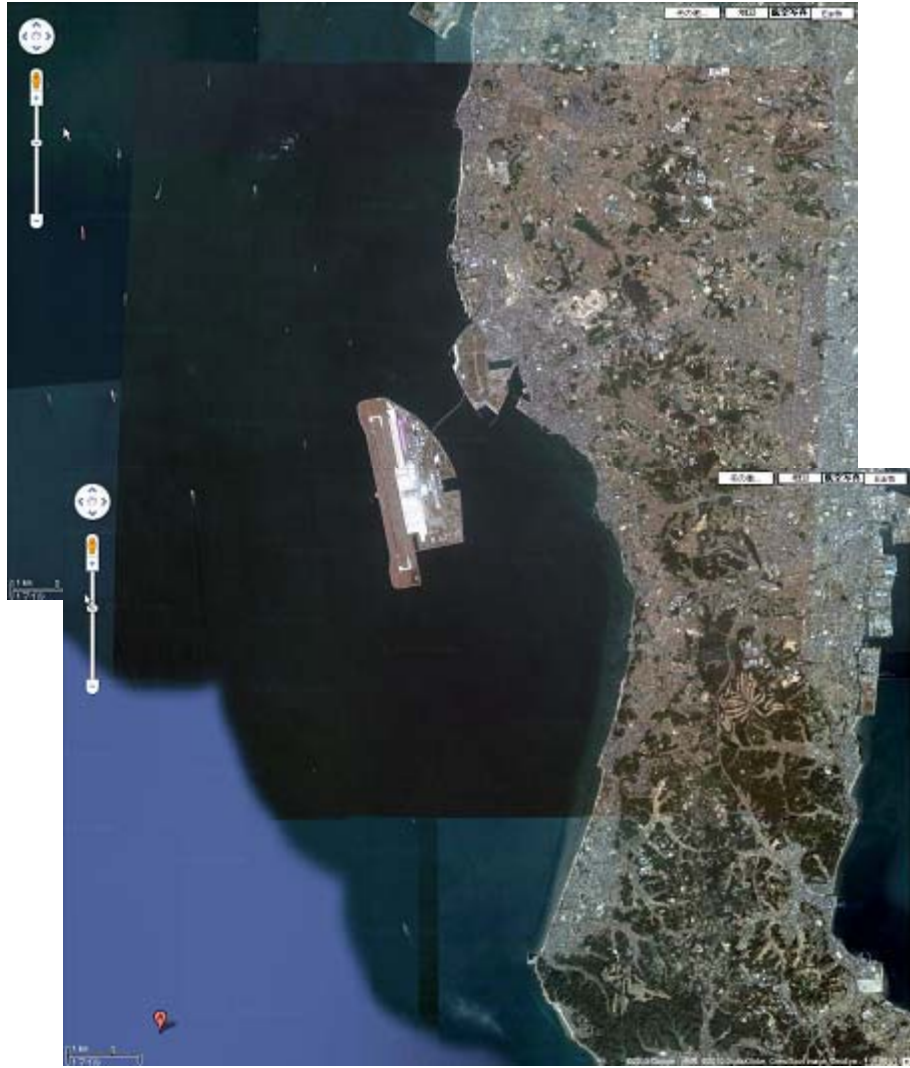
图 5. 6 (6) 沿岸景觀 (知多半島北部)