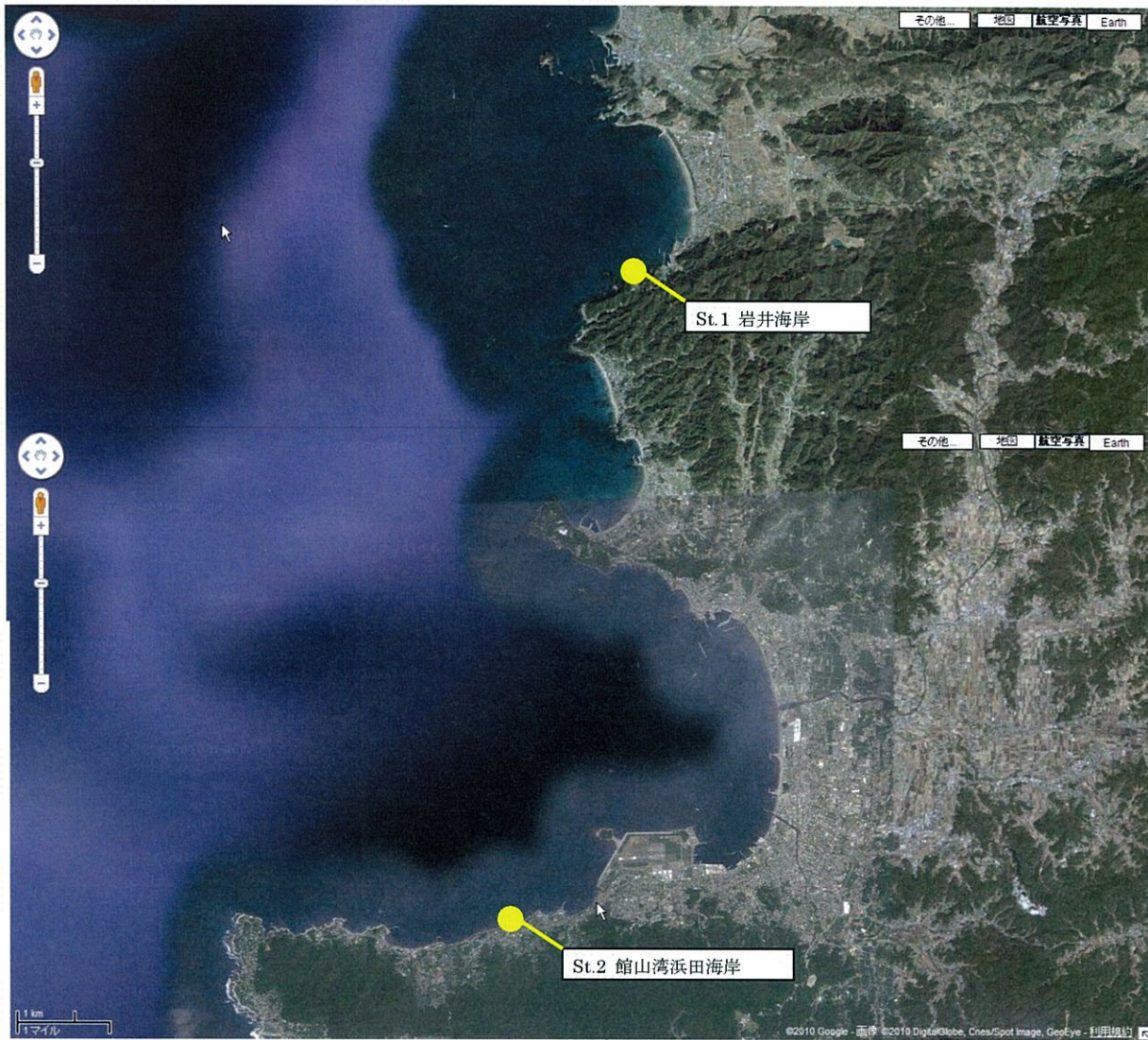
図5. 2. 17 (6) 沿岸域(東京湾(平成20年度環境小調査地点))