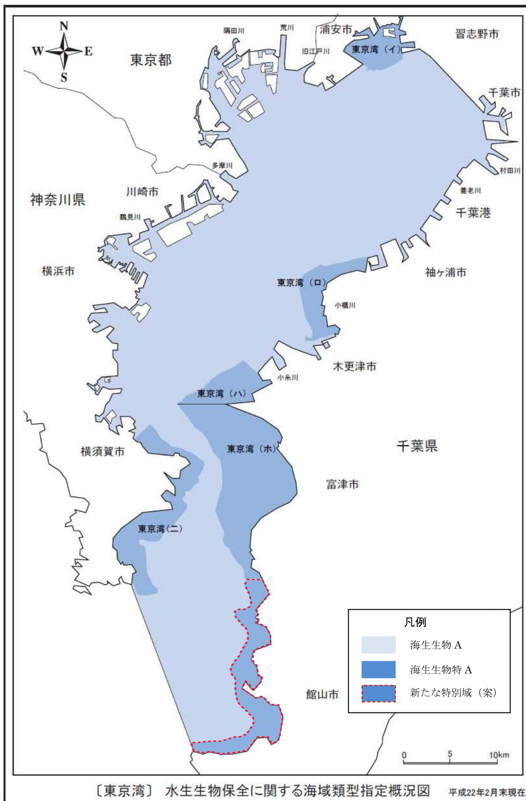
図5. 2. 18 (1) 特別域検討対象水域 (1)