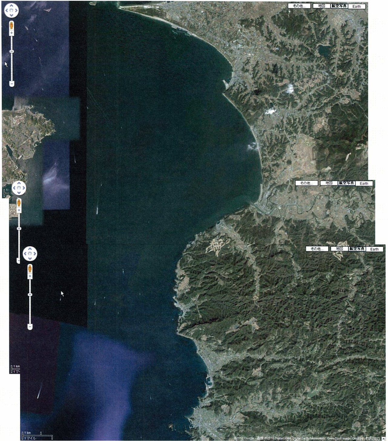
図5. 2. 17 (5) 沿岸域 (東京湾 海域生物特A (木))