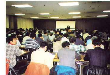
冷媒回収技術者登録講習会