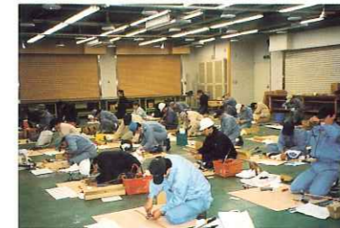
冷凍空気調和機器施工技能士の実技試験

国家資格である冷凍空気調和機器施工技能士の育成や冷凍空調施設工事業所の認定制度の普及啓発の実施、技術者の育成