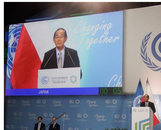
原田大臣の閣僚級ステートメント