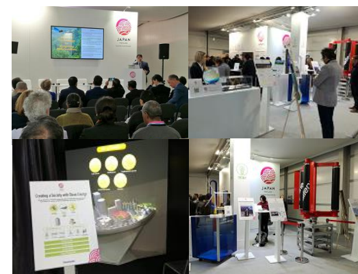
ジャパンパビリオン

■ ジャパンパビリオンにおいて、「日本の気候変動対策支援イニシアティブ2018」をはじめ、我が国の取組や貢献を紹介するイベントを多数開催。