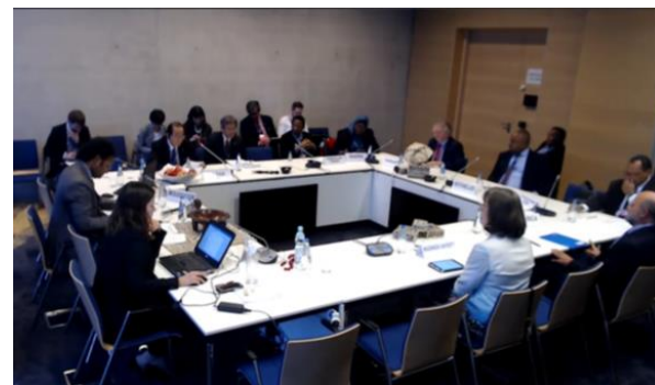
タラノア対話の閣僚級円卓会議