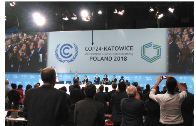
パリ協定実施指針の採択時