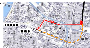
新規に軌道を敷設した区 間