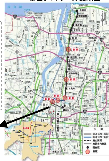
<富山ライトレール路線図>