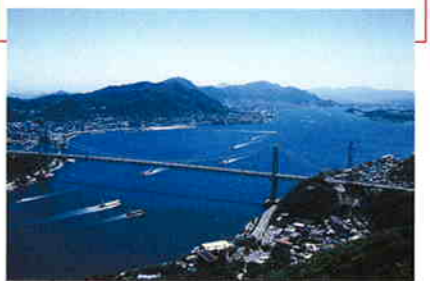
関門橋の下を大小の船が行き交う

海峡のいちばん狭いところは、「早瀬の瀬戸」と呼ばれ、幅わずか700m。潮流が激しく、大小の船が行き交う難所。壇ノ浦の合戦、武蔵と小次郎の巖流島の決闘など、歴史とロマンを彷彿とさせる。