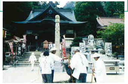
お遍路さんは全国各地から集まる

大窪寺は、四国霊場第88番札所。心願成就を願って出かけた四国遍路の旅を締めくくると大窪寺の鐘とお遍路さんの鈴の音が、四季折々の景観のなかで響きわたる。