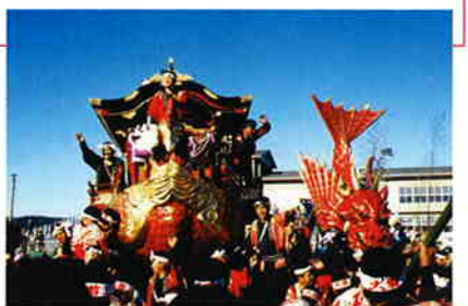
曳子のかけ声と鉦や太鼓の音のなか、勇壮華麗な曳山の車輪がきしむ

唐津くんちは、唐津神社の伝統的な秋祭り。唐津くんちの最大の呼びものは14台の曳山行列で、車輪のきしむ音とともに鉦や笛、太鼓の音、そして各ヤマゴとに微妙に異なるお囃子が聞こえる。