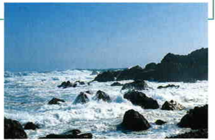
太平洋の荒波が岩礁に砕け散る

室戸岬に押し寄せる波の音が、ときには大きく、ときにはかすかに、御厨人窟の洞内に響く。1200年前、弘法大師が激しい修行をした当時の様子が偲ばれる。