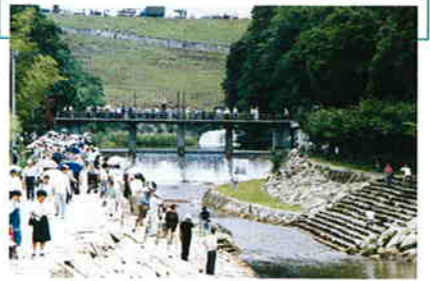
ゆるぬきでほとぼり出た水の流れるは、堤防下ではせせらぎとなる

満濃池のゆるぬきとは、毎年6月中旬、田植えを前に池の「ゆる」(取水栓)を抜く豊作祈願の儀式。勢いよく放出される水音は、豊作を祈る人々の心に響きわたる。