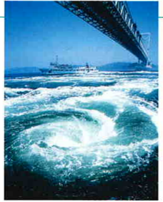
観潮船から見た渦潮と大鳴門橋。間近に見る渦潮には、引き込まれそうな迫力がある

鳴門海峡では、潮の干満によって大小無数の渦が生じ、春と秋の大潮時に最大となる。竜巻のような大きな轟音をたて、交錯しながら流れていくさまは壮観である。