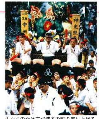
男たちのかけ声が博多の町を盛り上げる

祇園山笠は、7月1日に始まり、10日の「流れ昇き」を経て15日の「追い山笠」で最高潮となる。「オイサッオイサッ」の昇き手のかけ声と勢い水の水しぶき、博多手一本、博多祝い唄などが一体となった博多の夏の風物詩。