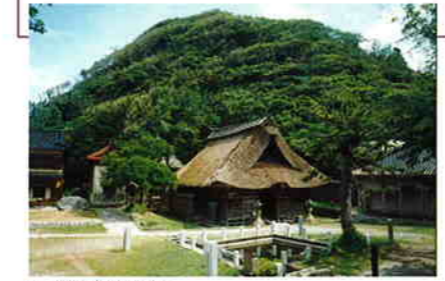
茅葺きの拝殿と社舎

能生白山神社がある尾山では、7月ごろヒメハルゼミの大合唱が聞こえる。「音頭取」と呼ばれる雄に合わせて一斉に鳴いたり、鳴きやんだりするさまは圧巻であり、現実社会を忘れさせてくれるひとときである。