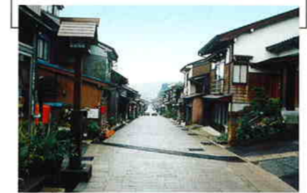
石畳も美しい諏訪町通りのエンナカ

八尾の町の坂道に沿って流れる水路をエンナカと呼び、耳を澄ますと心地よい音がする。その水音が、9月の「おわら風の盆」の時には聞こえなくなる。民謡「おわら」が三味線、胡弓などの音色に合わせて流れ、坂の多い街の路地裏に響く。