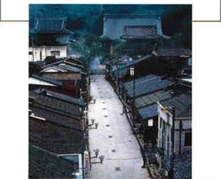
風情ある街並の八日町通り。右奥に見えるのが瑞泉寺

南砺市井波地域は信仰と木彫りの里。朝の5時、瑞泉寺の鐘が響きわたるころから、町のあちこちで「トントン」「コツコツ」と木槌を打つ音、ノミで木を刻む音が聞こえてくる。地域ではその音と木の香りのある景観づくりに取り組んでいる。