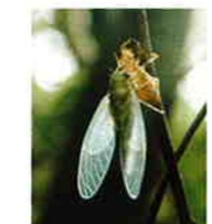
羽化後まもない雌

能生白山神社がある尾山では、7月ごろヒメハルゼミの大合唱が聞こえる。「音頭取」と呼ばれる雄に合わせて一斉に鳴いたり、鳴きやんだりするさまは圧巻であり、現実社会を忘れさせてくれるひとときである。