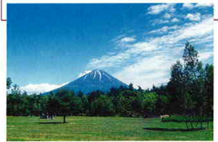
公園からは富士山の姿も間近に見られる

西湖周辺は、富士山の雄姿を間近に眺められる、野鳥の宝庫である。野鳥の森公園ではヤマガラやコガラなどが、青木ヶ原樹海の散策路ではホトトギス、ジュウイチ、ミソサザイなどの声が聞ける。