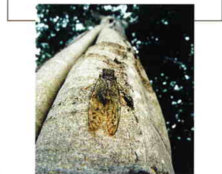
木にとまって鳴くヒグラシ

本多の森は、金沢市街中心部の河岸段丘に沿って残されているタブ、スダジイなどの緑豊かな森。夏の朝と夕方、この森から降り注ぐヒグラシの蟬時雨は、一帯に清涼感を醸し出し、往來する市民に親しまれている。