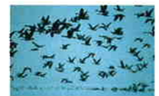
雪が舞うなか、オオヒシクイの大きな鳴き声が響きわたる

日本最大のオオヒシクイの越冬地。国の天然記念物オオヒシクイのたく力強く響きわたる鳴き声は、冬空を震わせる。野鳥や植物など自然の宝庫・福島潟は、環境学習に最適で、市民グループの活動も盛ん。