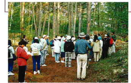
野鳥の姿とそのさえずりを楽しむため、多くの人が訪れる

八ヶ岳、南アルプスなどの山並みと、眼下には諏訪湖を眺めながら、野鳥の声を楽しめる。この一帯は、県の「小鳥の森」に指定されており、「野鳥の塩嶺」とも呼ばれるほど野鳥が多く生息することでも知られている。初夏には、カッコウ、キビタキ、アカハラなどの賑やかなさえずりを楽しめる。