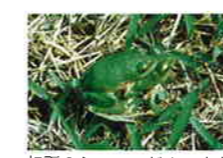
初夏のシュレーゲルアオガエルの抱接

八島湿原の八島ヶ池は、貴重なカエルの生息地。6月から「カララララ」とふつうのアマガエルよりずっと高い鳴き声のシュレーゲルアオガエルや、「カッカカ」と鳴くヤマアマガエルの声を聞くことができる。