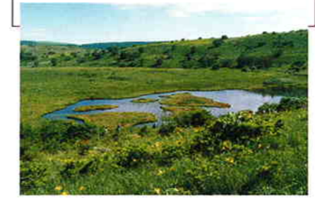
北からの八島湿原の風景

八島湿原の八島ヶ池は、貴重なカエルの生息地。6月から「カララララ」とふつうのアマガエルよりずっと高い鳴き声のシュレーゲルアオガエルや、「カッカカ」と鳴くヤマアマガエルの声を聞くことができる。