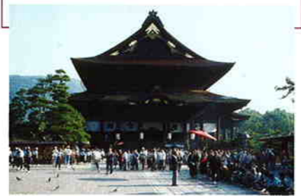
善光寺には、全国から多くの人が集まる

10時から16時まで、時の鐘として鳴る。昔は約20km離れた更埴・杏の里まで聞こえ、「善光寺の鐘の音を聞いた杏はよく実る」と言われていた。平成10(1998)年の冬季オリンピックには開会を告げる鐘として全世界に響きわたった。