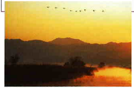
潟上空を飛ぶオオヒシクイ

日本最大のオオヒシクイの越冬地。国の天然記念物オオヒシクイのたく力強く響きわたる鳴き声は、冬空を震わせる。野鳥や植物など自然の宝庫・福島潟は、環境学習に最適で、市民グループの活動も盛ん。