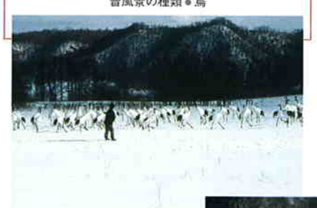
鈴餅のときは数百羽が集まる

冬期に鈴餅が行われ、多いときには300羽を超えるタンチョウを眺めることができる。また、つがいが鳴き合う声や狐を警戒する声、若鳥の声など鳴き声のバリエーションも楽しめる。