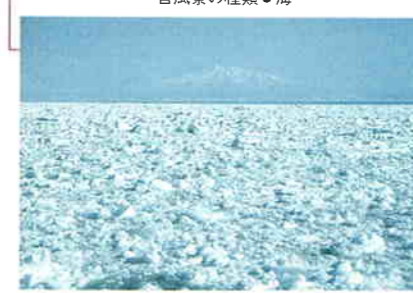
網走港からの眺め。遠くに見えるのは斜里岳

流水は、毎年1月下旬から3月中旬ごろに、南宗谷から知床にかけて流れ着く。巨大な氷塊を見ることもできる。浜辺で耳を澄ませると、流水のせめぎ合う音が「キュー」「グー」「クー」と聞こえてくる。北の海の冬を象徴する音風景である。