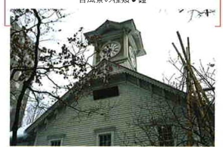
周囲にビルがないころは、その音は4km四方に響いたという

札幌のシンボルとして親しまれている時計台(旧札幌農学校演武場)に時計と鐘が設置されたのは明治14(1881)年。現在も休むことなく鐘の音を響かせ、時を告げている。