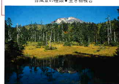
秋、自然探勝路から望む旭岳

アイヌの人たちが「神々の遊ぶ庭」と呼んだ大雪山。その主峰旭岳の山麓にある自然探勝路を散策すると、水河期から生息するナキウサギの声や、コマドリ、ミソサザイ、ルリビタキなど多くの野鳥の声が聞こえる。