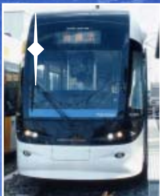
富山ライトレール