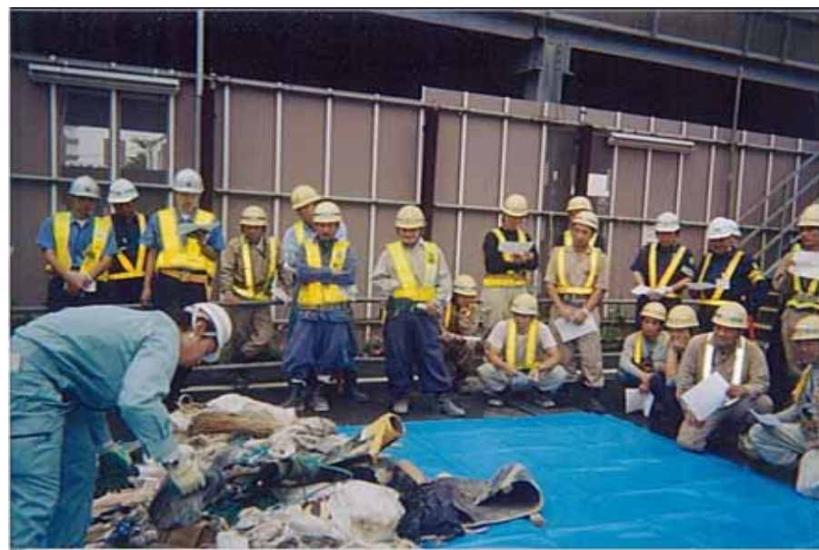
2 . 実際分別デモ