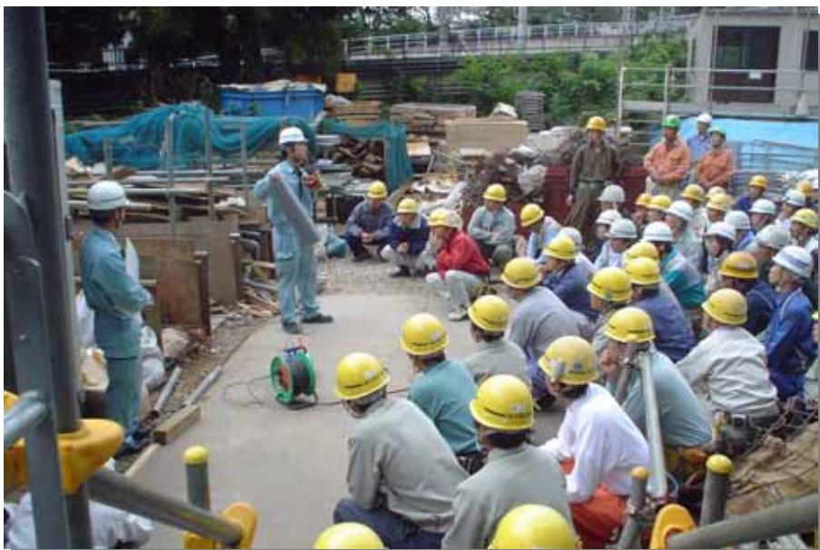
1 . 単品抜き取りデモ