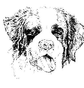
セント・バーナード