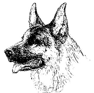
ジャーマン・シェパード