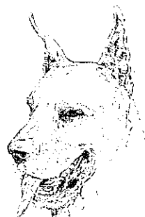
グレート・デーン