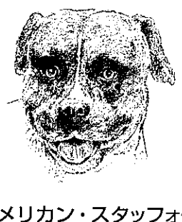
アメリカン・スタッフォードシャー・テリア (アメリカン・ピットブル・テリア)